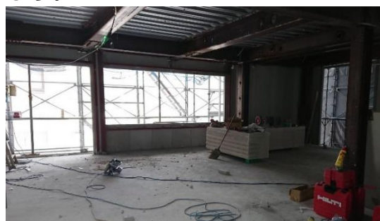
↓下は上棟式時の写真(4階バルコニー部分)